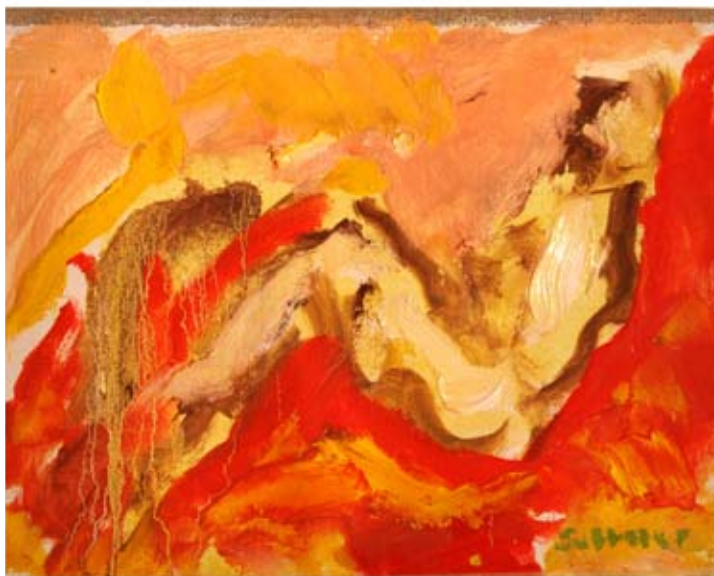
Kvinna i korgstol 2006

att rytmiskt och måleriskt arbeta med färger, former och valörer demonstrerat och preciserat bildkonstens egenart, arbetat med att låta färg och form, harmonier och dissonanser, rytm och rörelse, kontraster och glidande övergångar i bilden påverka våra sinnen direkt genom utan att gå omvägen över semantik och syntax.