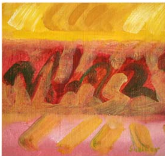
Tecken i naturen 70-tal