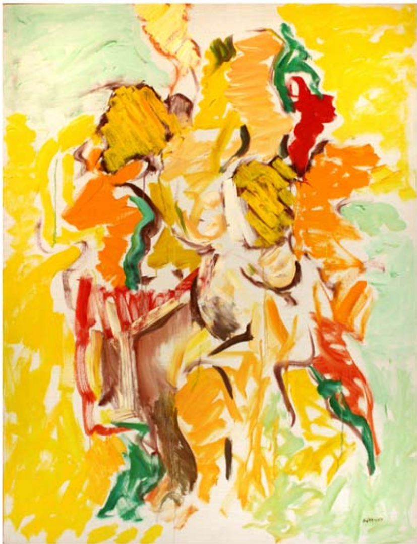
Kvinna med bockfot 2006